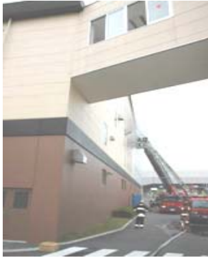
「かざぐるま」での火災

今後につきましては、火災事故対策に万全を期し、再びこのような事故が起こらないよう努めてまいりますので、ご理解・ご協力のほど、よろしくお願いいたします。